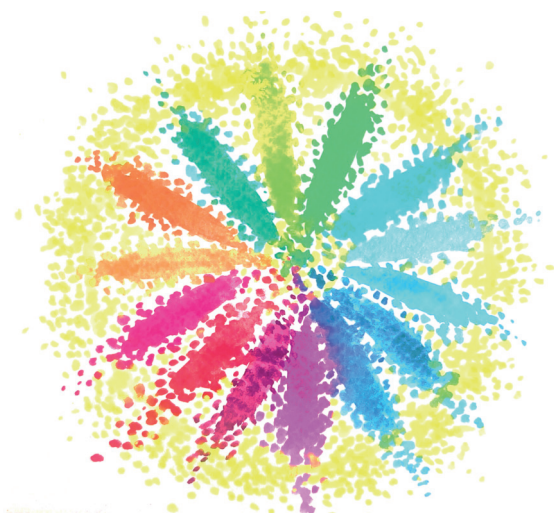
Fig. 2 - L'interesse generale come cerchio esterno, dove i molti e variegati soggetti attivi nella cura dei beni comuni dimostrano "interesse al disinteresse"

Costituzione italiana, in ricerche ormai antiche, e nei patti con i cittadini; (iii) che la proposta di un settore pubblico che faciliti l'empowerment e l'autonomia iniziativa non deve essere vista come sostitutiva dei servizi pubblici, che consideriamo standard novecenteschi che vanno sia assicurati e difesi che ibridati e innovati. Quando i servizi standard si intrecciano ai servizi ibridi e condivisi, in accezione sussidiaria, ecco un valore aggiunto comunitario che, per così dire, li aumenta (Ciaffi, 2024).