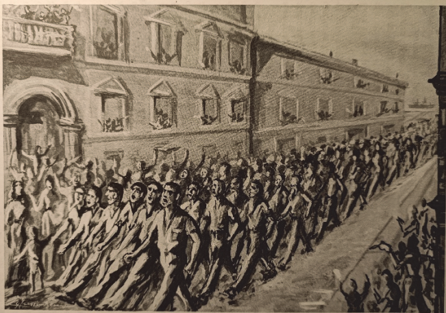
Prigionieri messi in libertà del campo «5» di Toronto, sfilano per la città inquadri ed al canto di inni patriottici. Aprile 1946.

In C.G. Baghino (a cura di), Fascist Camp , Centro Editoriale Nazionale, Roma 1960, fuori testo.