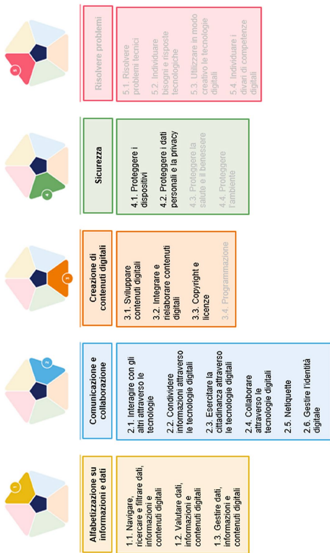
Fig. 1 – Aree e sotto-competenze del framework DigComp 2.2 include (in nero) ed escluse (in grigio) nella prova INVALSI sulle competenze digitali