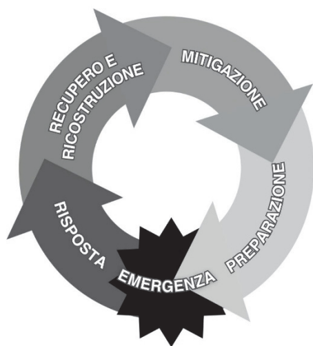
Fig. 1 - Il ciclo di gestione dei disastri

In relazione a tali assunti, "il ciclo di gestione dei disastri" (Figura 1) è stato proposto come frame analitico utile a declinare l'intervento in termini operativi. Esso consente di focalizzare l'attenzione sull'interazione tra condizioni di rischio e vulnerabilità e di mostrare l'interdipendenza degli interventi in fase pre-emergenza e post-emergenza (UNISDR, 2015; Commissione Europea, 2023).