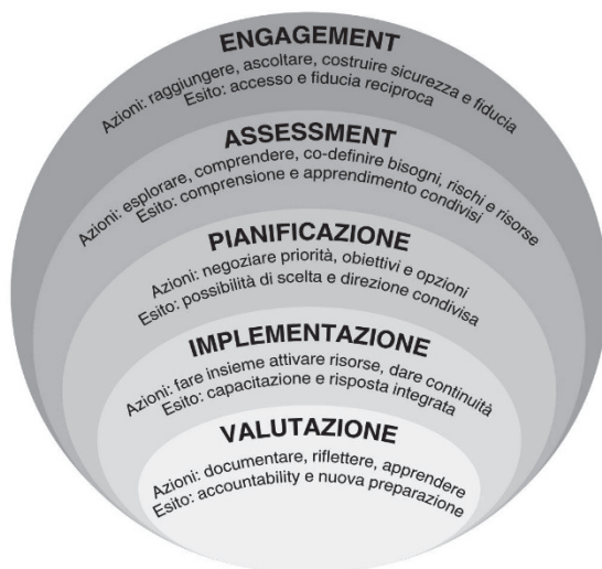
Fig. 3 - Il metodo nel disaster social work anti-oppressivo

La Figura 3 rappresenta questa circolarità: ogni passaggio influenza le condizioni del successivo e viene, a sua volta, riletto alla luce di ciò che accade nella relazione di aiuto e nel contesto colpito dal disastro.