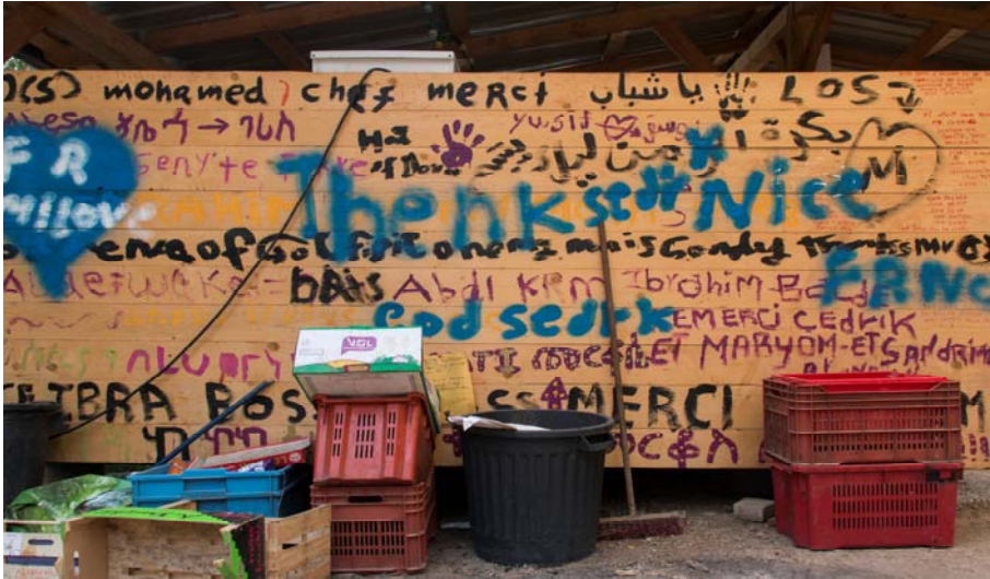
Fig. 1 – Scritture subalterne: in un accampamento di richiedenti asilo e transitanti in Val Roya, luglio 2017.

Frammenti e citazioni divengono, seguendo l'intuizione di Back e Puar (2013), epitaffi nel quadro di una dead sociology : una sociologia ridotta a lingua morta, incapace di scorrere nelle vene della società come strumento critico di riflessività, dedita invece a produrre concetti zombie e fatti fossili . La proposta degli autori è quella dei live methods , affinché la disciplina riconquisti una vita nel presente, utilizzando tutte le opportunità metodologiche della cultura digitale e aprendosi alla collaborazione con artisti, designers, musicisti, registi e curatori nell'immaginazione di nuovi stili ibridi di rappresentazione del sociale; ecco allora dispiegarsi la possibilità di una sociologia curatoriale , di una art based sociology , di una sociologia anfibia , e anche di una sociologia visuale e filmica.