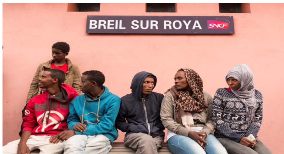
Fig. 3 – Aspettando il treno per richiedere l'asilo a Nizza, Breil sur Roya, luglio 2017.

Parole e scrittura, inoltre, sostengono e abilitano la comprensione sociologica, ma al tempo stesso occultano altre logiche di azione e verbalizzazione. Non occorre essere etnografi o sociologi per sapere che ciò che si dice è spesso diverso da ciò che si pensa e da ciò che si fa; e ancora, rivolgendosi a diverse cerchie sociali, uno stesso parlante produce discorsi variabili, non necessariamente coerenti. Qual è dunque la traccia di testo, fra le molte possibili, che dobbiamo usare per comprendere un qualunque fenomeno sociale? Urry (2005), a ragione, rileva la difficoltà, e l'urgenza, per le scienze sociali di vedere il multiplo, il casuale, l'emotivo, il sensuale.