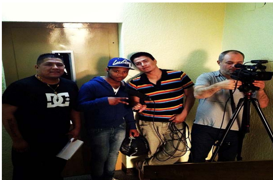
Fig. 5 – The gang academy. A scuola di riprese nella casa di un partecipante al laboratorio. Barcellona, 2013. Fonte: back stage della produzione di Buscando Respeto, il regista con tre protagonisti.

Cercare l'immagine che trafigge consiste in questo caso ricuperare la banale biografia dei soggetti della ricerca, mostrarli come padri/madri o come studenti, come ponteggiatori o donne delle pulizie, alla ricerca di un rispetto che rimane la moneta dei poveri quando la diseguaglianza impera; produrre una contro-visualità sulle bande, significa per i partecipanti al laboratorio liberarsi di tutti gli orpelli esotici attraverso cui si dispiega un'estetica mediatizzata del fenomeno (collane, bracciali, colori, vestiti, ecc.), esponendo viceversa la durezza della condizione materiale che vincola le loro vite: l'assenza di documenti, la crisi e la ricerca di un lavoro degno, la necessità di ricorrere all'economia informale per sopravvivere, l'espulsione e la segregazione scolastica, la crisi che ha desertificato nelle periferie le politiche giovanili, e le opportunità, rivolte alle classi popolari.