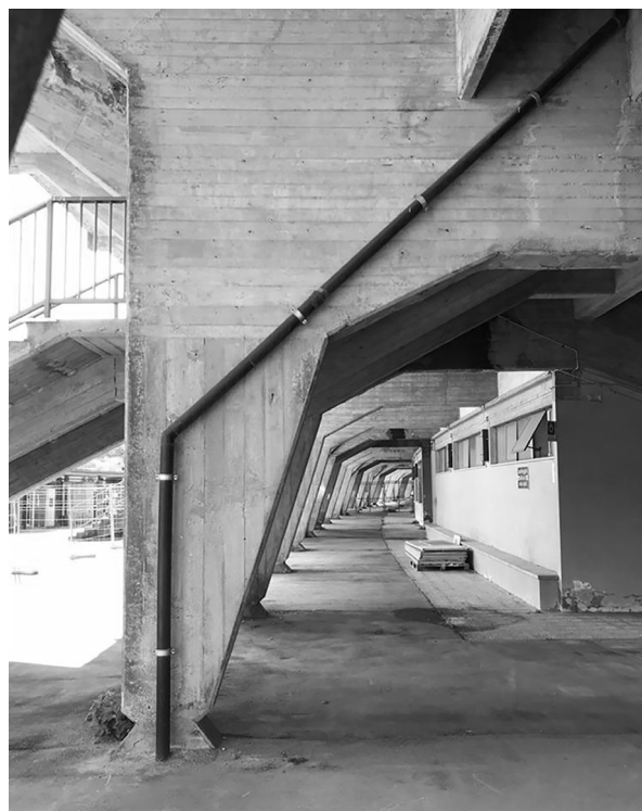
Fig. 1. Image of the distinct grandstand of the Marcello Melani stadium in Pistoia, now unfit for viewing sporting events.

As mentioned above, representation is necessary for the construction and conservation of collective memory. In fact the word history (which we can refer to as the story of the past of a community) came from ιστορία (the research), derived from the same Indo-European etymological root of the verbs ὄραω and video , which both have the meaning of to see. The view is therefore strictly connected to the construction of history and of memory. Also in this case, just before the restructuring and demolition of the Pistoia stadium, documentation was necessary for maintaining the memory. This documentation was carried out with some traditional graphic representations (sketches, drawings and manual survey), but also with new technologies, such as laser scanner survey and photogrammetry. The survey using laser scanners affected the east tribune, whose demolition had already been prepared, but also the rest of the stadium. The graphic rendering was performed through the Cyclone, Recap and AutoCAD softwares. The photogrammetric documentation was instead reworked