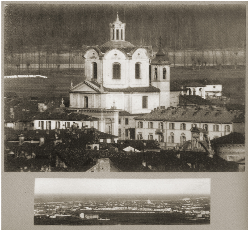
Fig. 05. La figura è composta da due fotografie di Francesco Negri scattate dalla collina di Sant'Anna a Casale Monferato. Le immagini contrappongono una veduta panoramica (in basso) ad una ripresa effettuata dallo stesso punto con il teleobiettivo Negri-Koristka (in alto).

di architettura tale scelta comporta per esempio l'isolamento oppure la contestualizzazione, la veduta assiale o di scorcio, ecc. Il fotografo di un'architettura può scegliere di isolarla completamente dall'intorno, di mantenere elementi ridotti di contesto o di allargare l'inquadratura includendone ampie porzioni. Se all'interno dell'immagine ritroviamo una divisione in finestre che funzionano anche in modo indipendente, la composizione risulta rafforzata: abbiamo un'inquadratura più semplice dentro un'inquadratura più complessa.