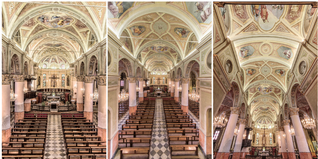
Fig. 04. Photographs A and B are taken from the same point of view with a focal length of 20mm and 10mm respectively on Advanced Photo System (APS) format; photograph C was taken from a lower point of view and with a focal length of 10mm, always on APS format with angled sensor.